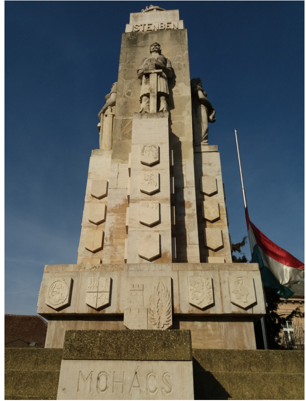
3. kép: A nagykanizsai Nagy-Magyarország-emlékmű