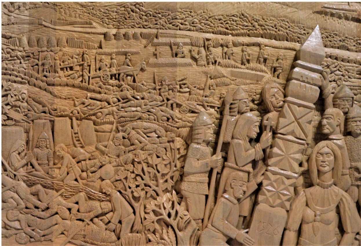
4. kép: Wegroszta Zoltán: Kanizsai Dorotya eltemeti a mohácsi csatában elesetteket Fig. 4: Zoltán Wegroszta: Dorotya Kanizsai is burying the fallen of the battle of Mohács

szintén Kanizsai Dorottyát ábrázolja a mohácsi csata halottainak eltemetése közben (4. kép). 46 Az alkotás valószínűleg a nádorasszony nevét viselő kanizsai kórházban talál helyet. Mindennek ellenére az esztergomi érseket, zágrábi püspököt és erdélyi